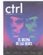
ILUSTRACIÓN PORTADA Sergio Mas