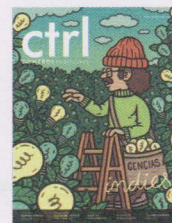
El Hombre Tucán ILUSTRACIÓN PORTADA