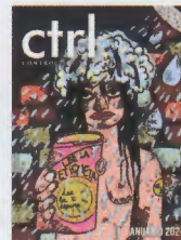
DISEÑO PORTADA Noemí Ruoz Soldevila