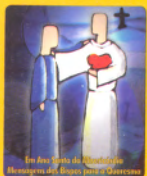
Um Ano de Vida Consagrada. Mensagens dos Bispos para os Quaresmais.